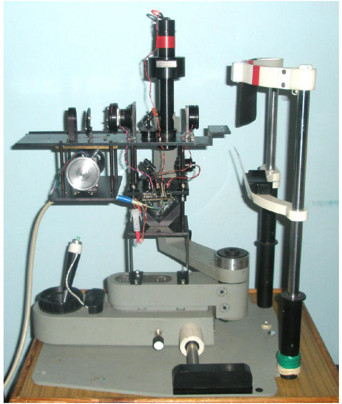
Макет вимірювача аберційної рефракції ока: ліворуч - 3D-модель конструкції макету, праворуч – загальний вигляд установки